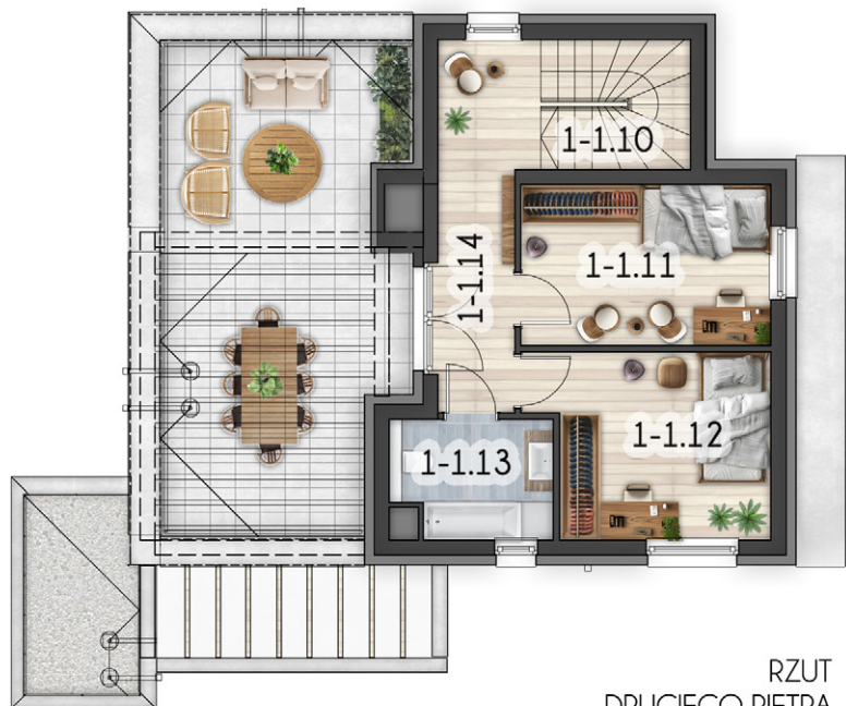
RZUT DRUGIEGO PIĘTRA

* WYMIARY POMIĘSZCZEŃ, LOKALIZACJE PRZYBÓRÓW SANITARNYCH I INNE PODANO NA PODSTAWIE PROJEKTU BUDOWLANEGO. W TOKU BUDOWY MOGA WYSTĄPIĆ RÓŻNICE W STOSUNKU DO PROJEKTU WYNIKAJĄCE ZE SPECYFIKI PRAC BUDOWLANYCH (JEŻELI FAKTYCZNIE USYTUOWANIE URZĄDZENI NA RYSUNKU WYNIKA Z LOKALIZACJI PRZYŁĄCZY INSTALACYJNYCH W AKTUALNYM PROJEKCIU)