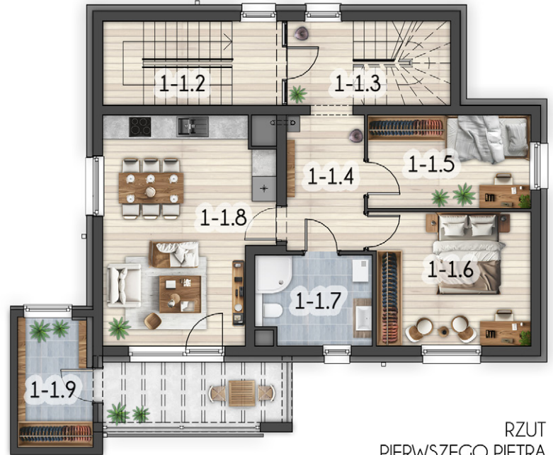
RZUT PIERWSZEGO PIĘTRA