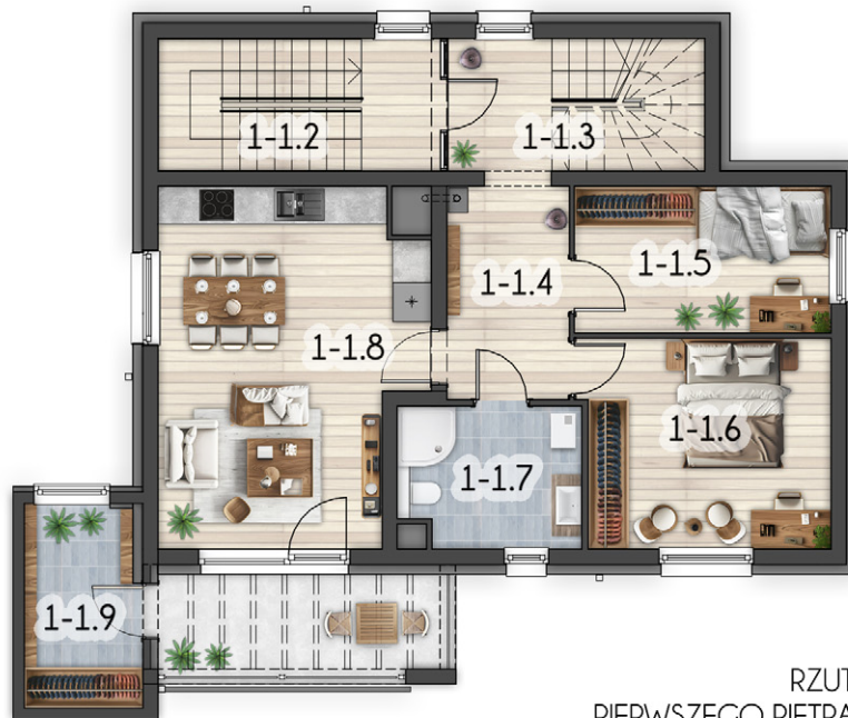
RZUT PIERWSZEGO PIĘTRA